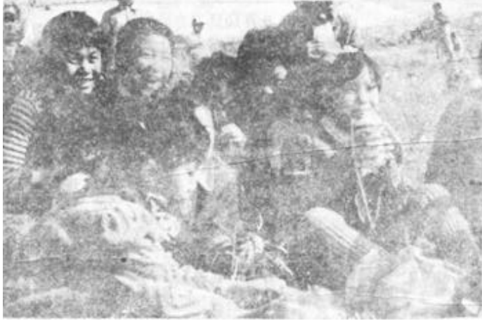
胜利油田第83中注意培养学生多方面的兴趣和爱好。图为学生们正在进行野营活动。