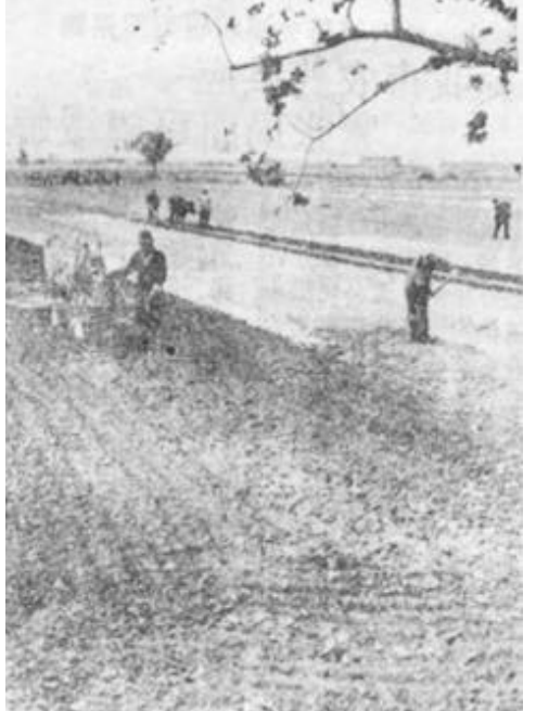
本版责任编辑 刘 究

东营区六户镇在遭受特大风暴后，迅速组织受灾村民抢时间播种玉米、高粱、棉花等农作物。图为六户镇李宅村民正在翻播棉花。